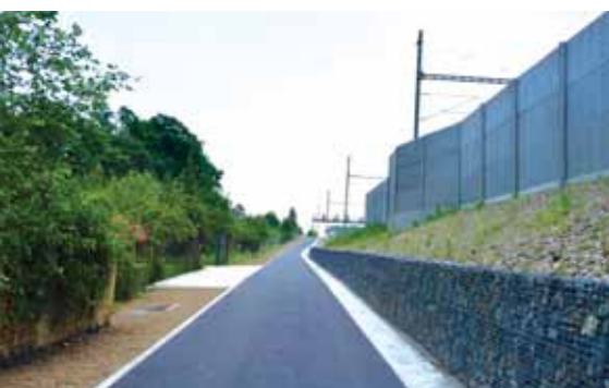
Ulice Ke Hrázi