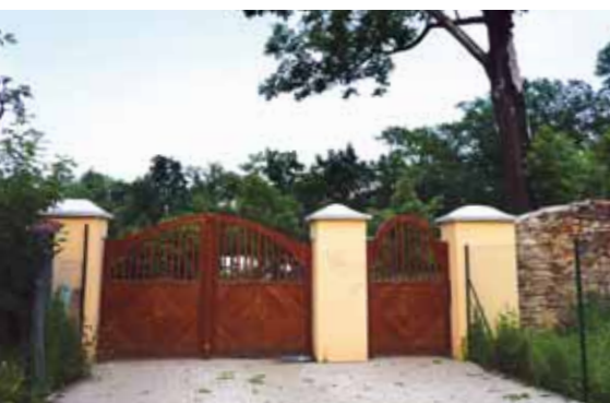
Nový vstup do parku z ul. Ke Hrázi