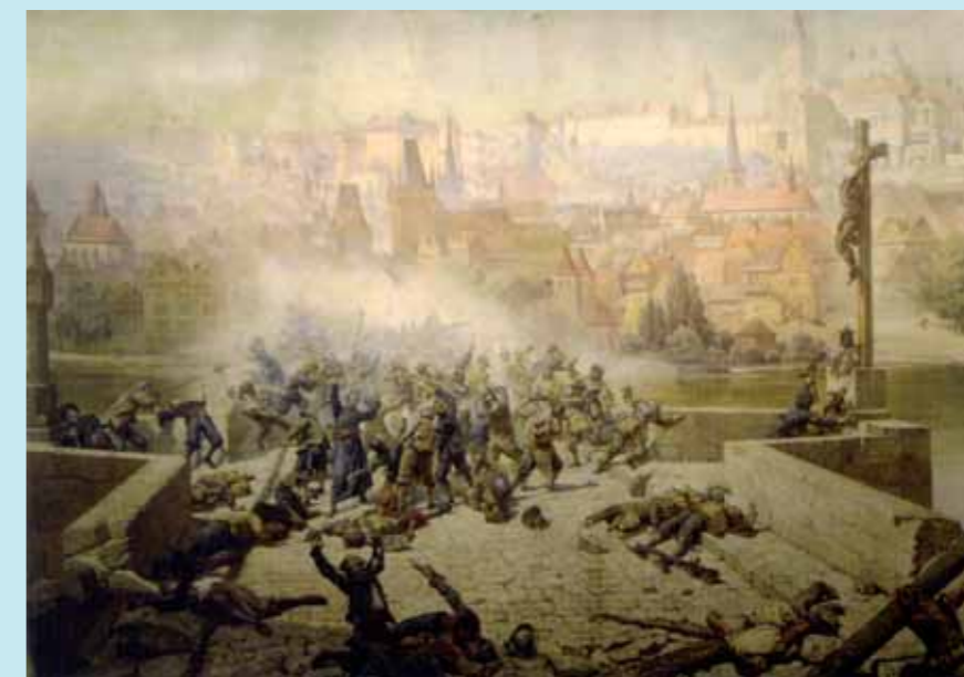
Boj studentů se Švédy na Karlově mostě roku 1648