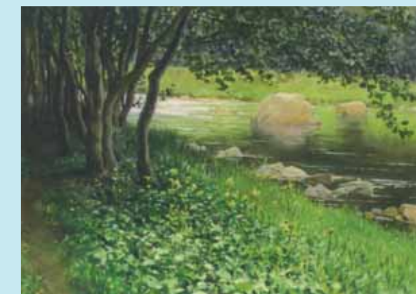
Partie u Potštejna (Divoká Orlice, 1906)